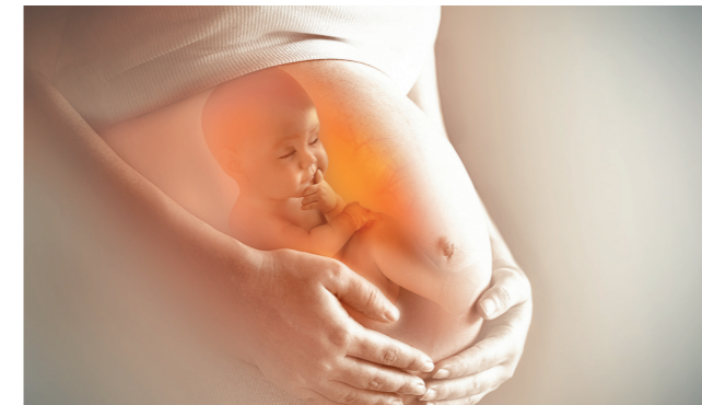
Seelische Traumen können weit zurückliegen – sogar vorgeburtlich.

Die Behandlung erfolgt bei Kindern ausschließlich durch eine völlig schmerzlose Lasertherapie und gegebenenfalls durch die Verabreichung von ausgetesteten Blüten.