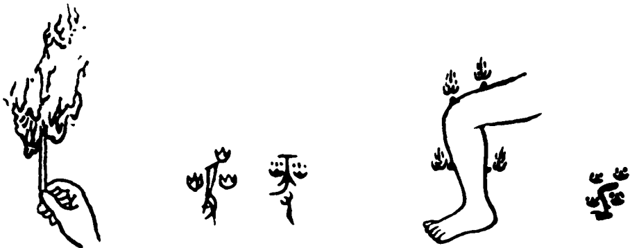
Abbildung 3: Vorgeschichtliche Darstellung einer Moxa-Behandlung. Die hier wiedergegebenen Darstellungen und Schriftzeichen stammen von alten Bronzefäßen, die man der Yin-Dynastie zuordnet (15.–11. Jh. v. Chr.). Die bildliche Darstellung des Moxens findet sich in den altchinesischen Schriftzeichen für Moxen wieder. Ein gutes Beispiel dafür, dass die chinesischen Schriftzeichen piktografische (bildhafte) Bedeutung haben. (4)

Ein weiteres altes literarisches Dokument über Moxa ist das Zouzhun. Es wird der Frühlings-Herbst-Dynastie zugeordnet, die 770 bis 476 v. Chr. regierte. (9) Ein anderes Akupunkturwerk aus jener Zeit beschäftigt sich mit dem Ernten von Moxa-Kraut. Ebenfalls aus dieser Zeit stammt eine Niederschrift, die feststellt, dass »zur Krankheit nichts mehr durchdringen kann, wenn wir angesichts einer Krankheit machtlos