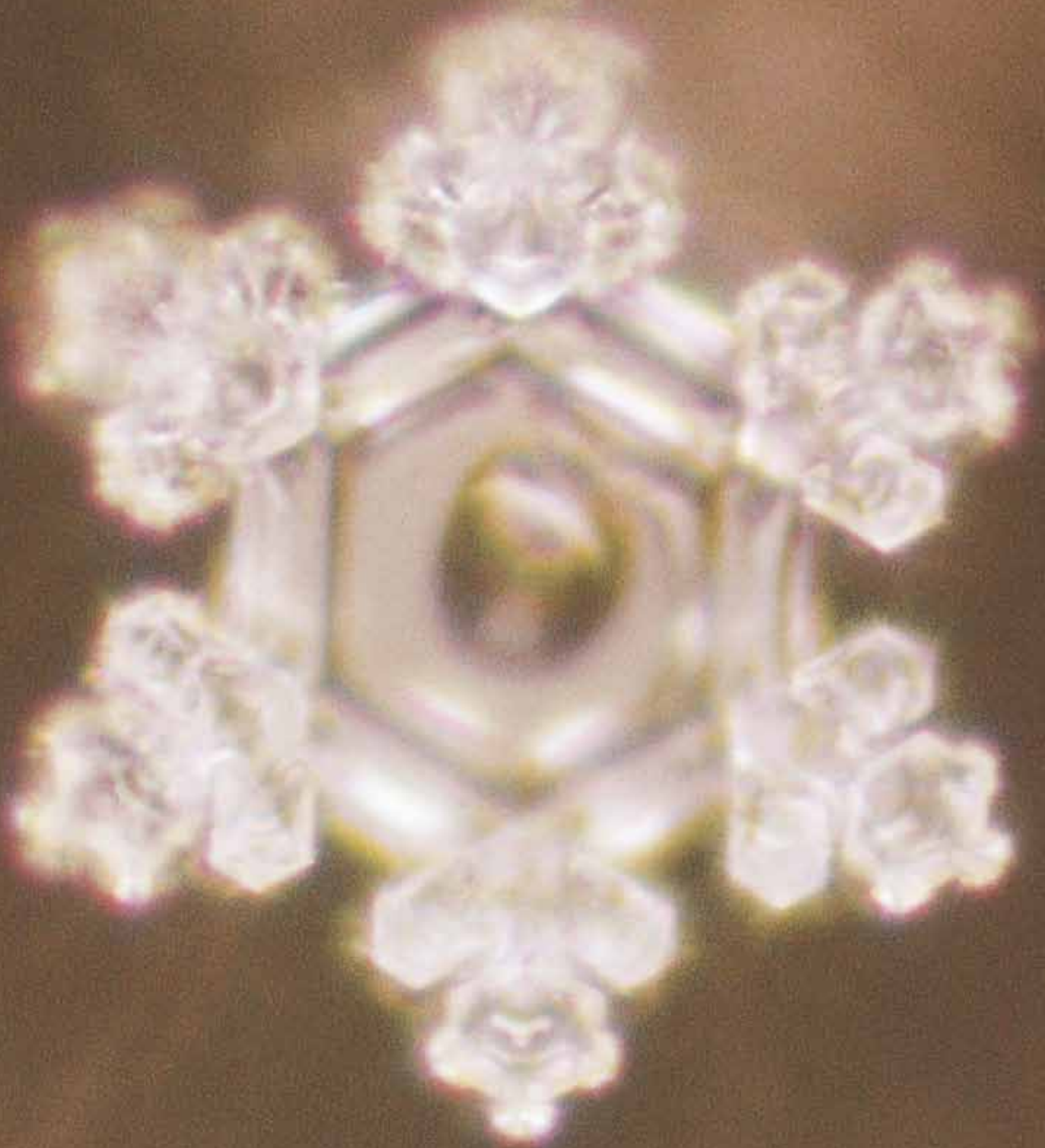
Das erste erfolgreiche Bild, das wir mit Mikrocluster-Wasser aufnehmen konnten.