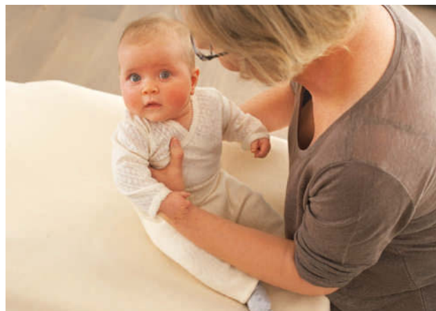
Lassen Sie Ihr Baby kurz zum unterstützten Sitzen kommen, bevor Sie es endgültig hochheben.