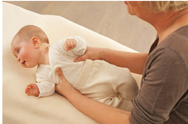
... Sie erklären ihm, was Sie mit ihm vorhaben, und drehen es dann auf die Seite, indem Sie Brust und Rücken mit beiden Händen stabilisieren.