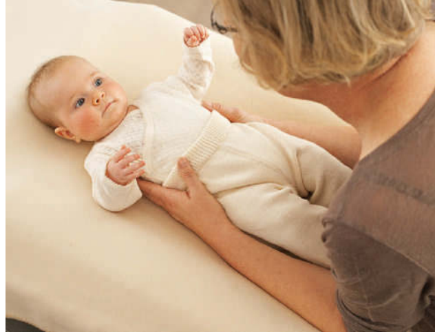
Zum Hochnehmen aus der Rückenlage nehmen Sie Ihr Baby zunächst im Schalenriff ...

Wenn Sie Ihr Baby aus der Bauchlage (in der Ihr Baby aber nicht schlafen sollte!) hochnehmen möchten, drehen Sie es zunächst zur Seite. Dazu stabilisieren Sie mit einer Hand Schulter und Rücken Ihres Babys und mit der anderen den Brustkorb. Sagen Sie ihm, was Sie vorhaben. Wenn es sich auf seinem unteren Arm etwas abstützen kann, ist es aktiv beteiligt. Dann neigen Sie Ihr Baby leicht nach vorn, sodass es kurz in einer gehaltenen sitzenden Position ankommt. Lassen Sie Ihr Baby beim Hochheben kurz den Kontakt zur Unterlage