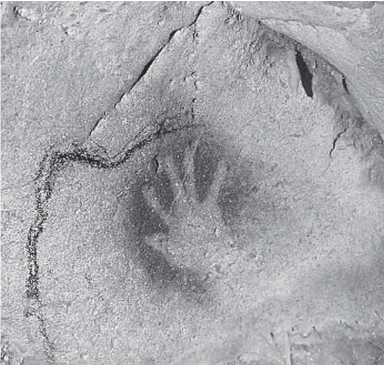
1. Abdruck einer menschlichen Hand in der Chauvet-Höhle in Südfrankreich. Diese Kunstwerke sind etwa 30 000 Jahre alt und wurden von Menschen hinterlassen, die aussahen, dachten und fühlten wie wir. Vielleicht wollte er oder sie sagen: »Ich war hier!«