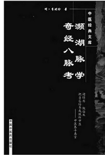
Abbildung 2 Studium der Acht Extra-Meridiane (oder Qi Jing Ba Mai Kao) wurde von Li Shizhen in der Ming Dynastie geschrieben.

Eine Vielzahl von Qigong Texten wurden in historischen TCM Dokumenten gefunden. In dem Werk Der Klassiker des Gelben Kaisers zur Inneren Medizin 4 (Abbildung 3), befinden sich acht Abschnitte, welche eindeutig die Qigong Theorie und Prinzipien der Qigong Therapie erwähnen, darunter Verweise zum Daoyin, „das Qi leiten und führen“ und Xing Qi, „das Qi lenken“. Zum Beispiel ist in „Abhandlung über die natürliche Wahrheit in der fernen Antike“ (Shang Gu Tian Zhen Lun), ein Kapitel im Abschnitt Einfache Fragen (Su Wen) des Klassikers des Gelben Kaisers zur Inneren Medizin zu lesen: