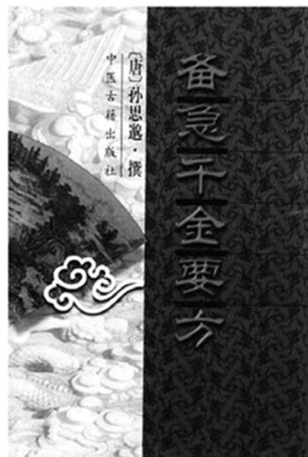
Abbildung 4 Essentielle goldene Verordnungen für Notfälle (Qian Jin Yao Fang) von Sun Simiao fasst die medizinischen Errungenschaften seiner Vorgänger von der Han bis zur Tang Dynastie zusammen und deckt hierbei die Bereiche Diagnose, Therapie, Akupunktur, Daoyin, Massage und lebenspflegender Formen ab.