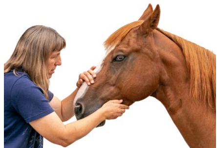
Eine gefühlvolle Behandlungsweise sorgt für das notwendige Vertrauen des Pferdes und den therapeutischen Erfolg.