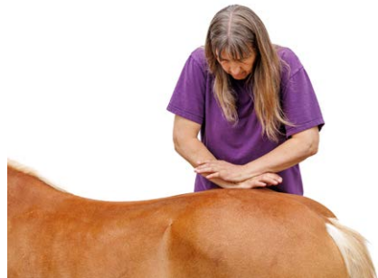
Alle Griffe sind in Wort und Bild nachvollziehbar dargestellt.