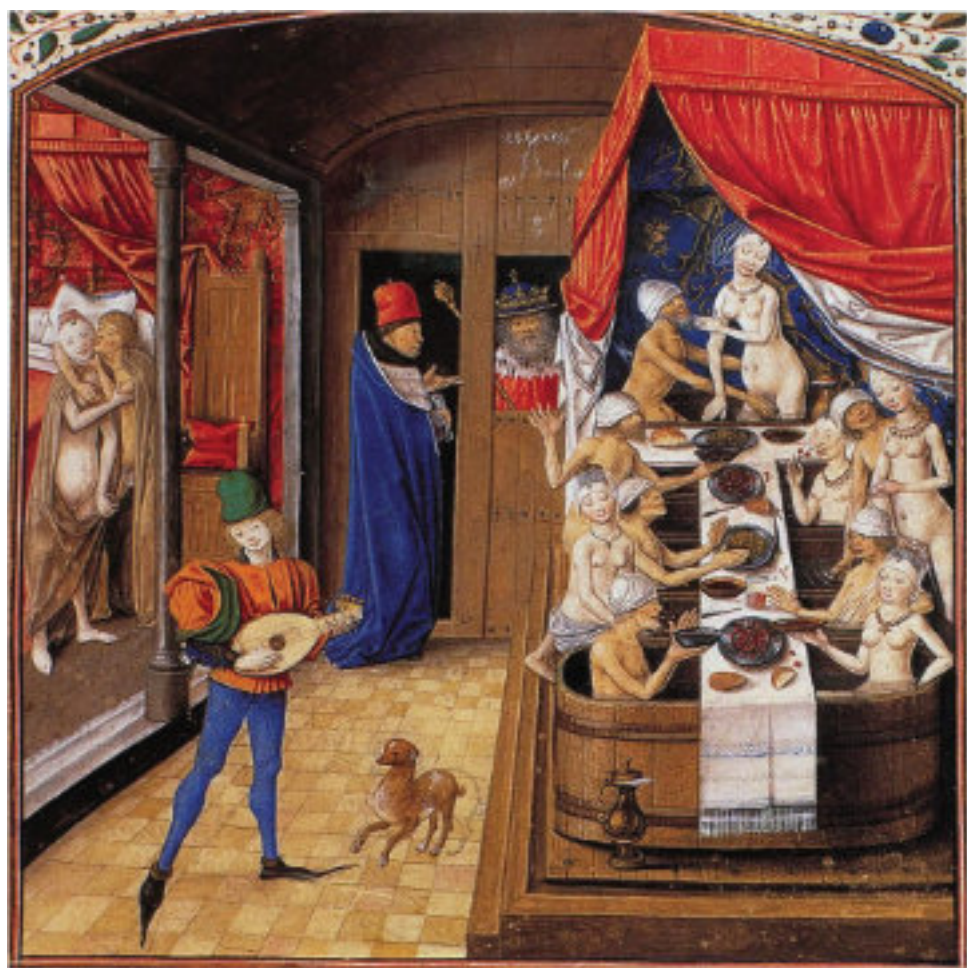
Facta et dicta memorabilia, um 1470, Ms. Dep. Breslau 2/2, f. 244, Digitalisat Archiv InstiTEM, Fotocredit: Staatsbibliothek Berlin