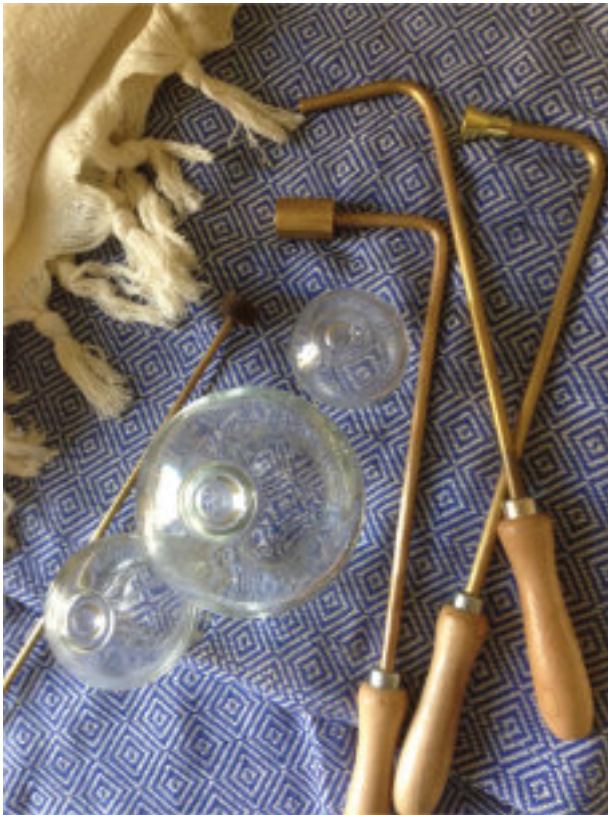
Kauterien und Schröpfgläser