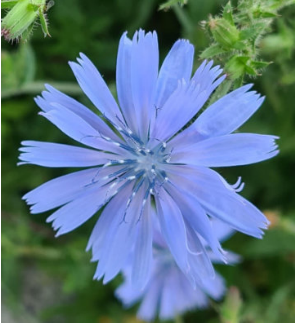
Wegwarte ( Cichorium intybus )