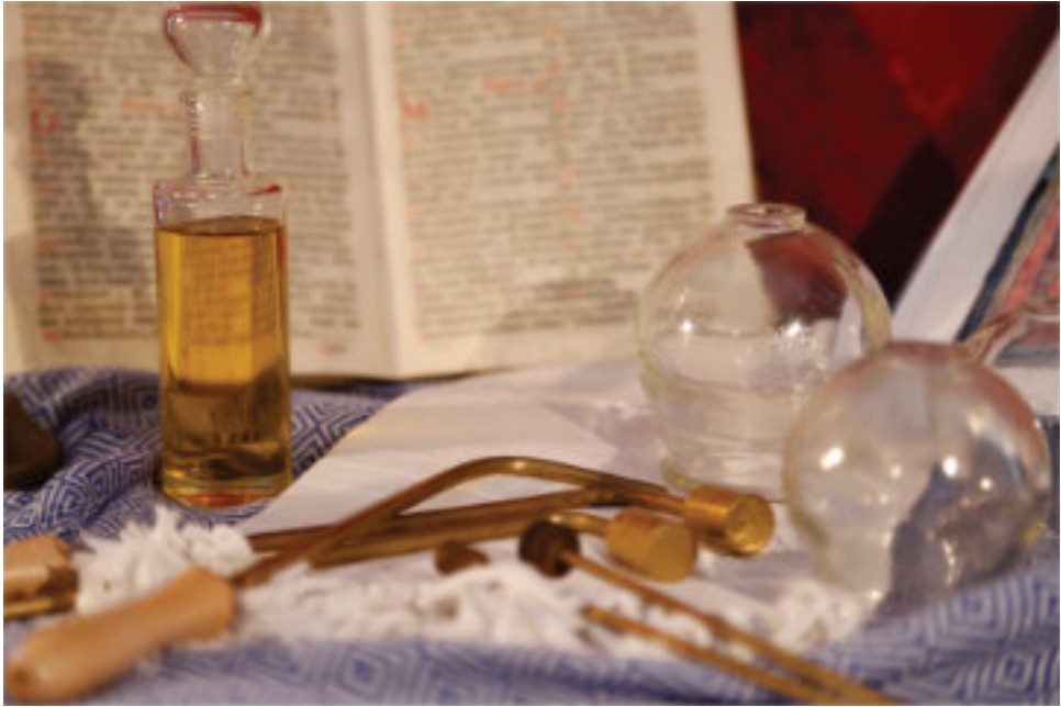
Kauterien und Schröpfgläser