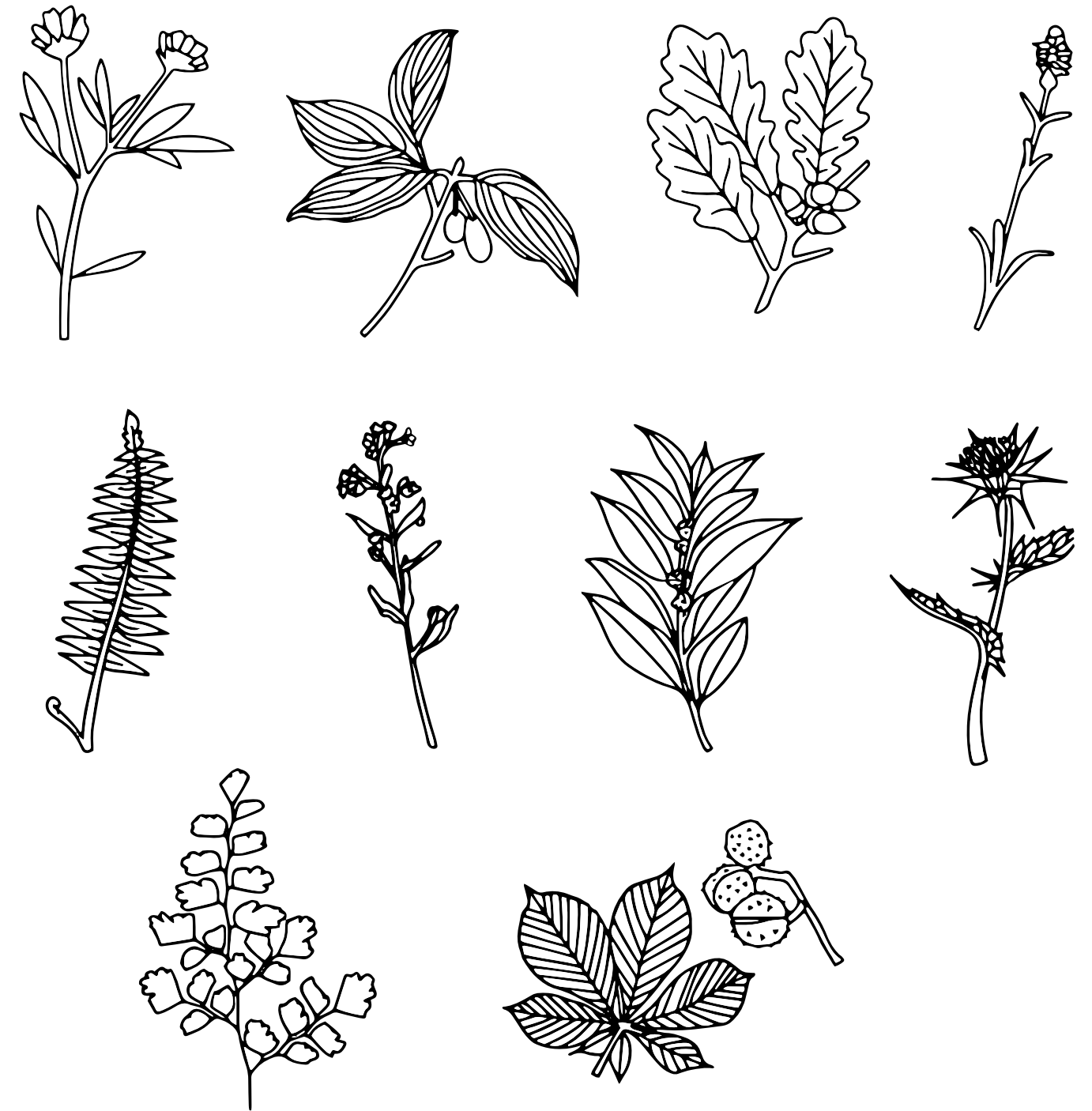
Löwenzahn ( Taraxacum ), Kamillenblüte ( Matricaria chamomilla ) Lorbeerblatt ( Laurus nobilis ), Kornelkirsche ( Cornus officinalis ) Schabziger Klee ( Trigonella caerulea ) Trauben- Eichen-Rinde ( Quercus petraea ) Gliedkraut ( Sideritis syriaca ) Mariendistel ( Silybum marianum ).