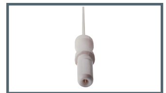
K = 1,5 mm Sicherheitsanschluss