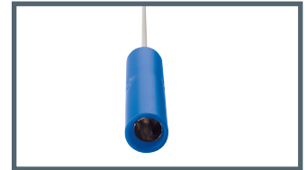
A = 4 mm Bananenstecker