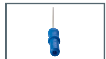
J = 2 mm Sicherheitsanschluss