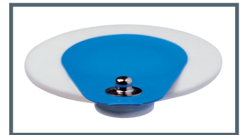
S = Druckknopf