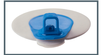
A = 4 mm Bananenstecker