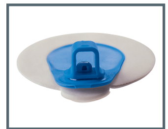
A = 4 mm Bananenanschluss