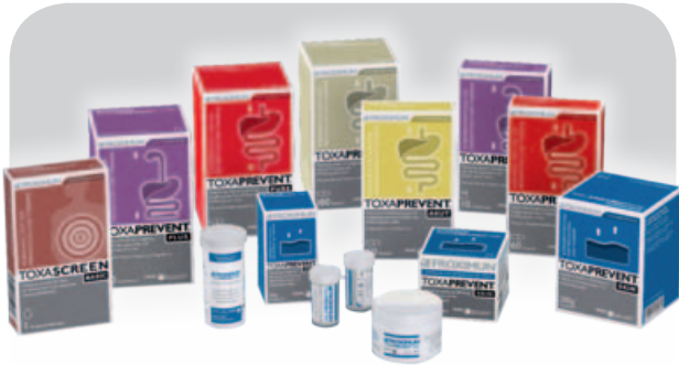
Die FROXIMUN® TOXAPREVENT® Produktserie – für die innere und äußere Anwendung